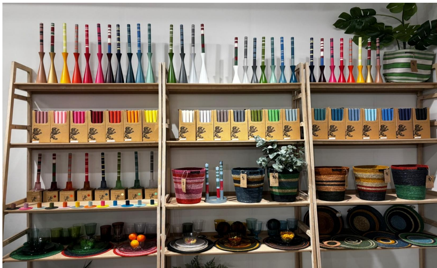
色や素材でブランドのストーリーを表現するブランドを多く見受けた