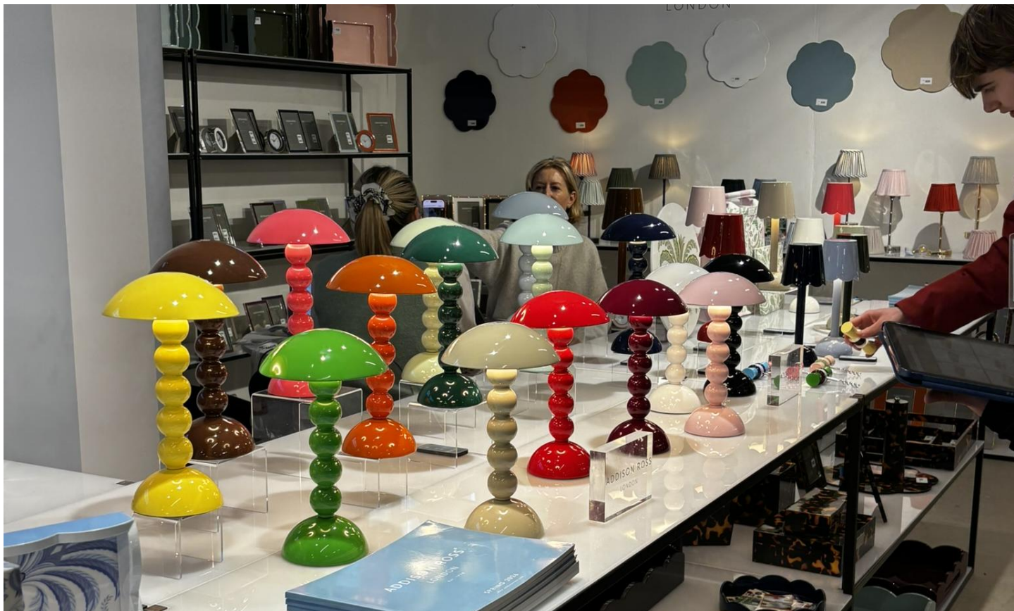
生活空間のアクセントになりそうなアイテムが人気