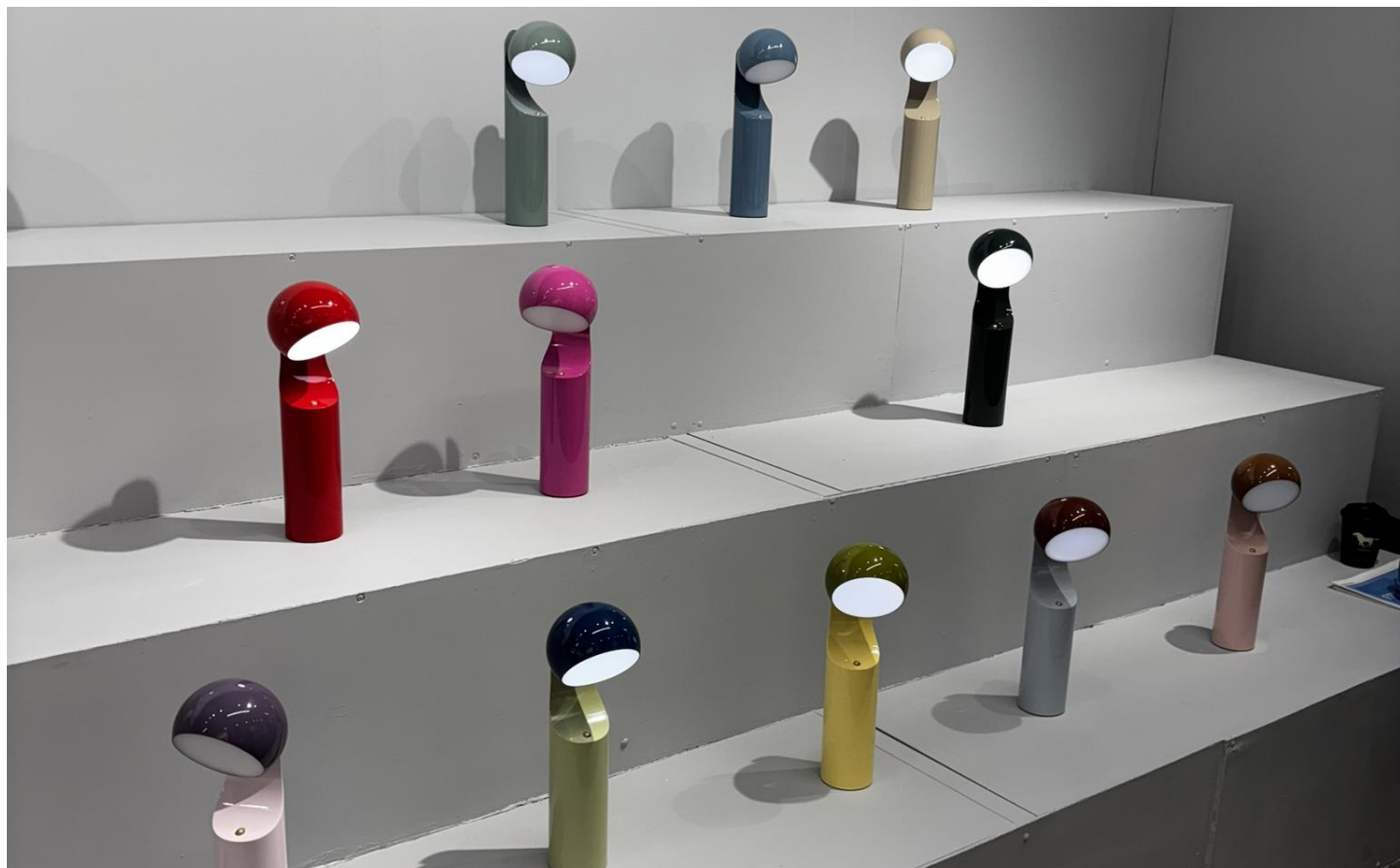
イノベーティブなデザイン性を重視したブランドに注目が集まる