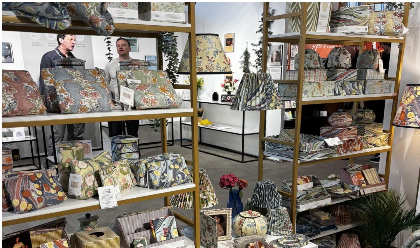
ブランドの世界観に触れる展示が好評