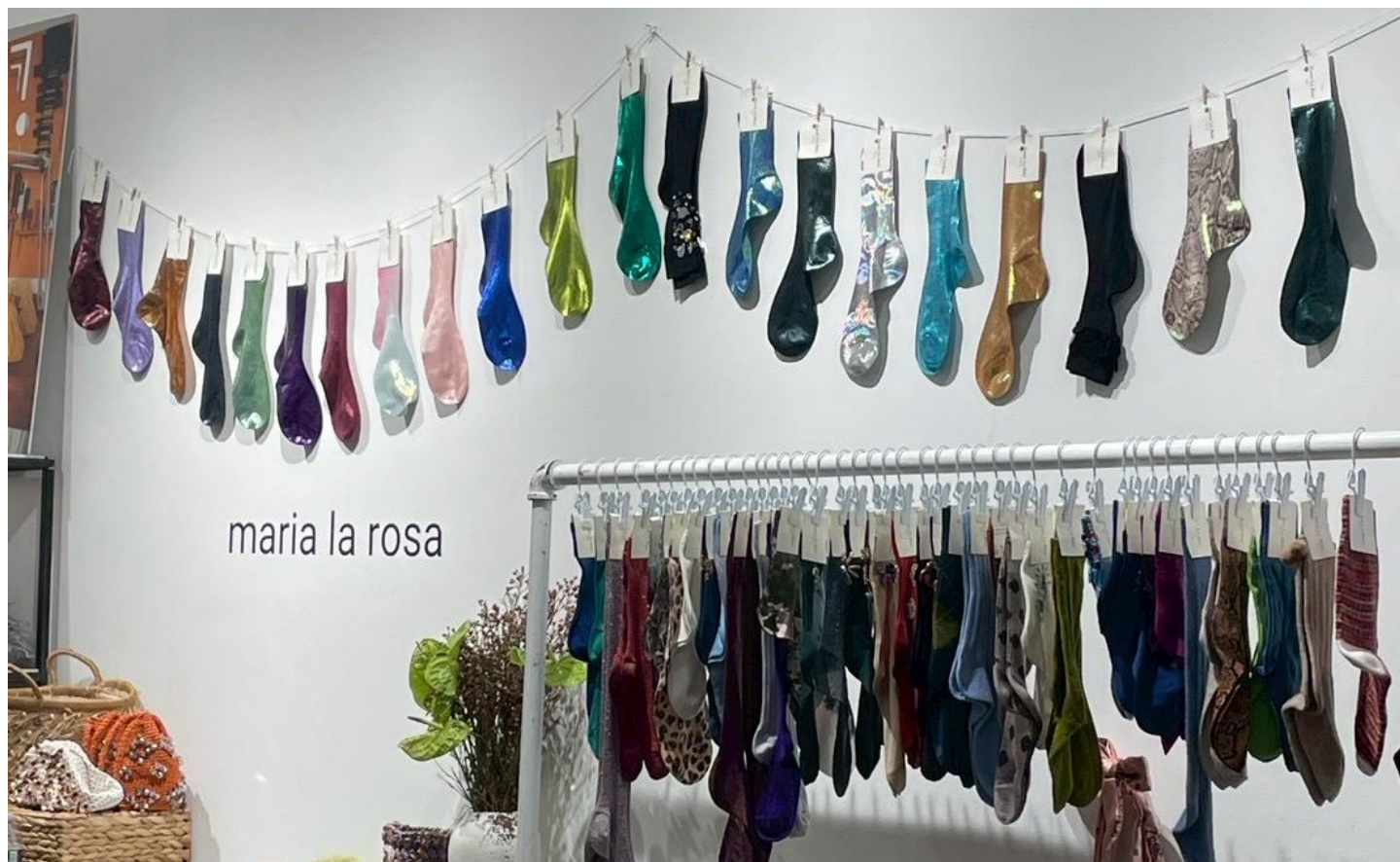
アパレル雑貨は海外ブランドが多数参加