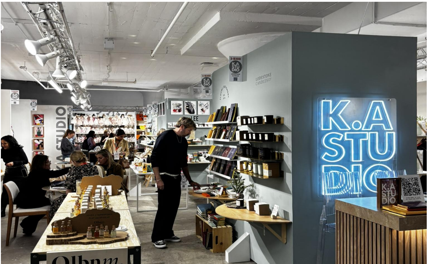
アメリカ全土、ヨーロッパからのバイヤーが来場