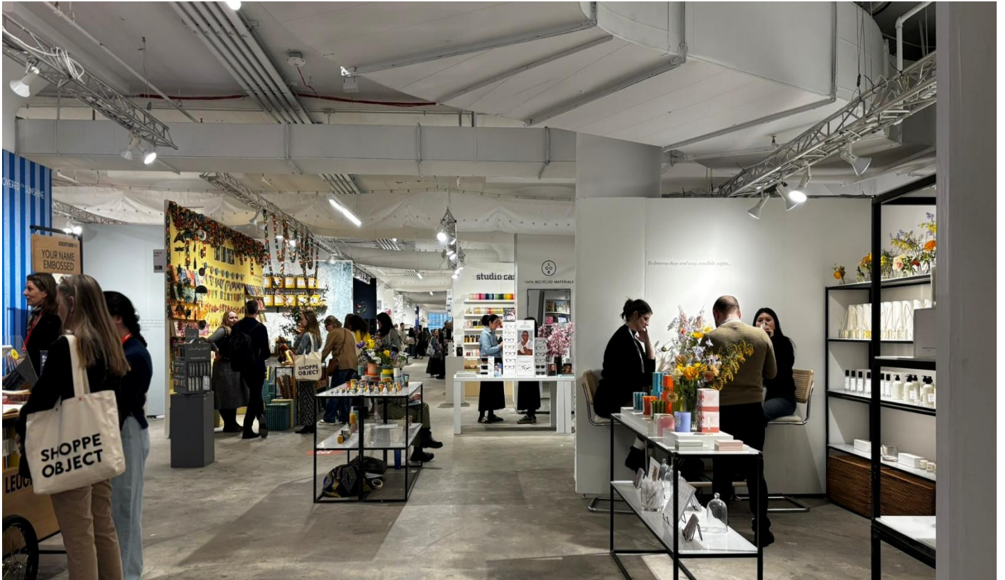
厳冬期にもかかわらず、他州他国からの多数の来場者で賑わう