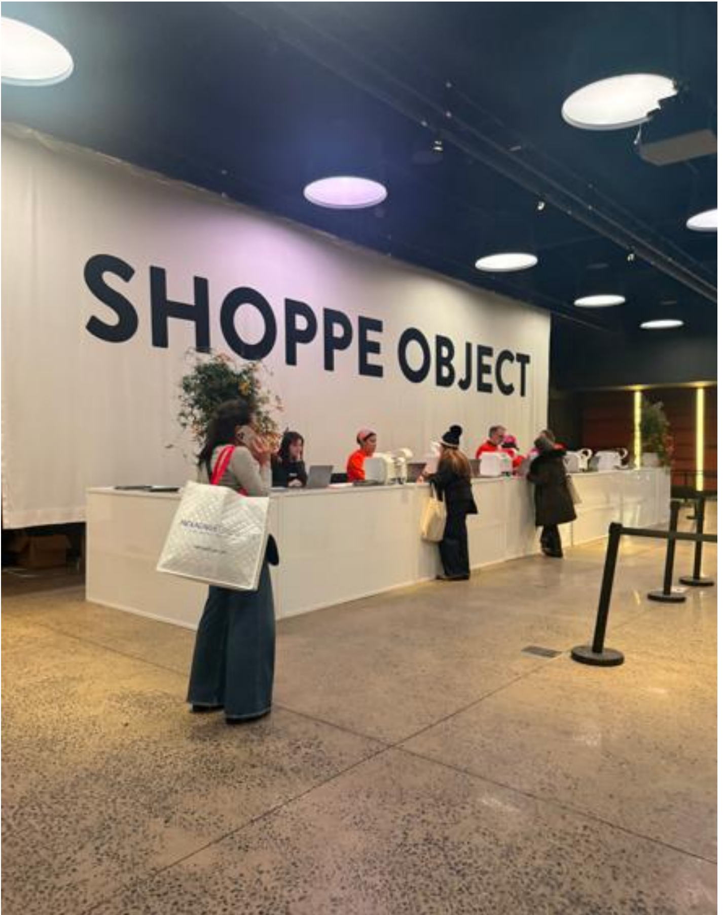
会場はチェルシー地区にある大型撮影スタジオ・イベントスペース