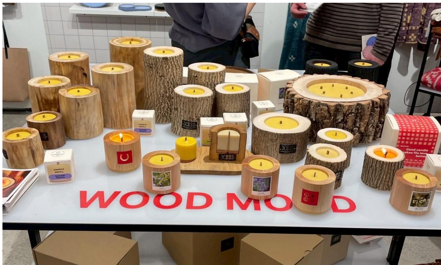
クラフト感があり、さらに自然資材を用いたプロダクトを多数展示