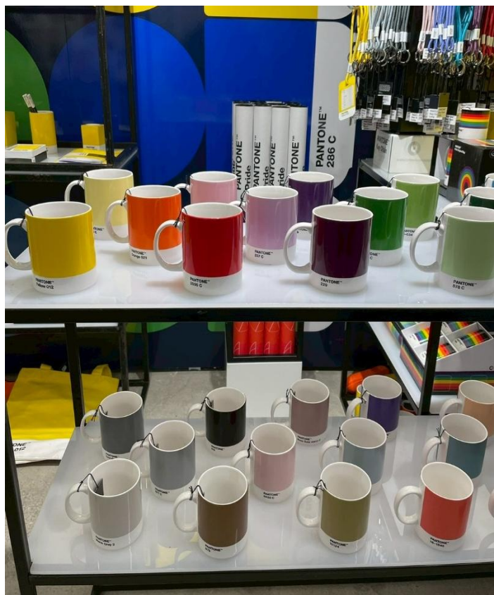
各ブランド工夫を凝らしたキャッチーなディスプレイ