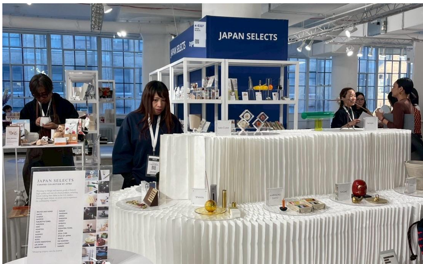
日本人クリエイターのアイテムをハイライトしたエリアが設けられるなど、日本製プロダクトの人気の高さがよくわかる