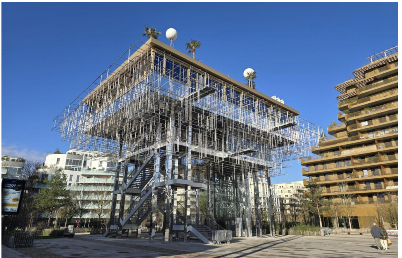
Line Renaud 広場と高床式パノラマレストラン Monsieur Claude