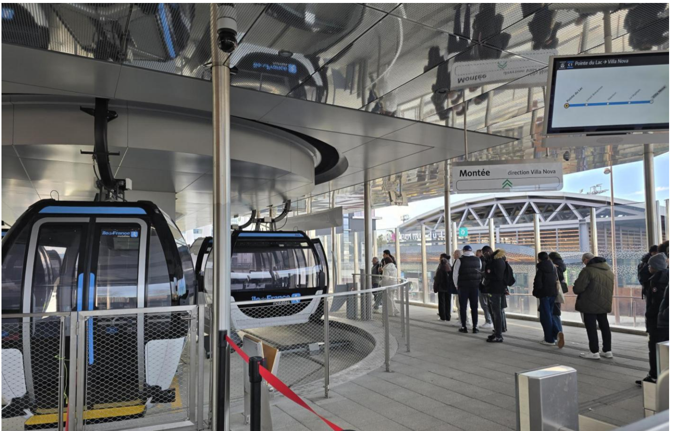
Lac Créteil 駅 2