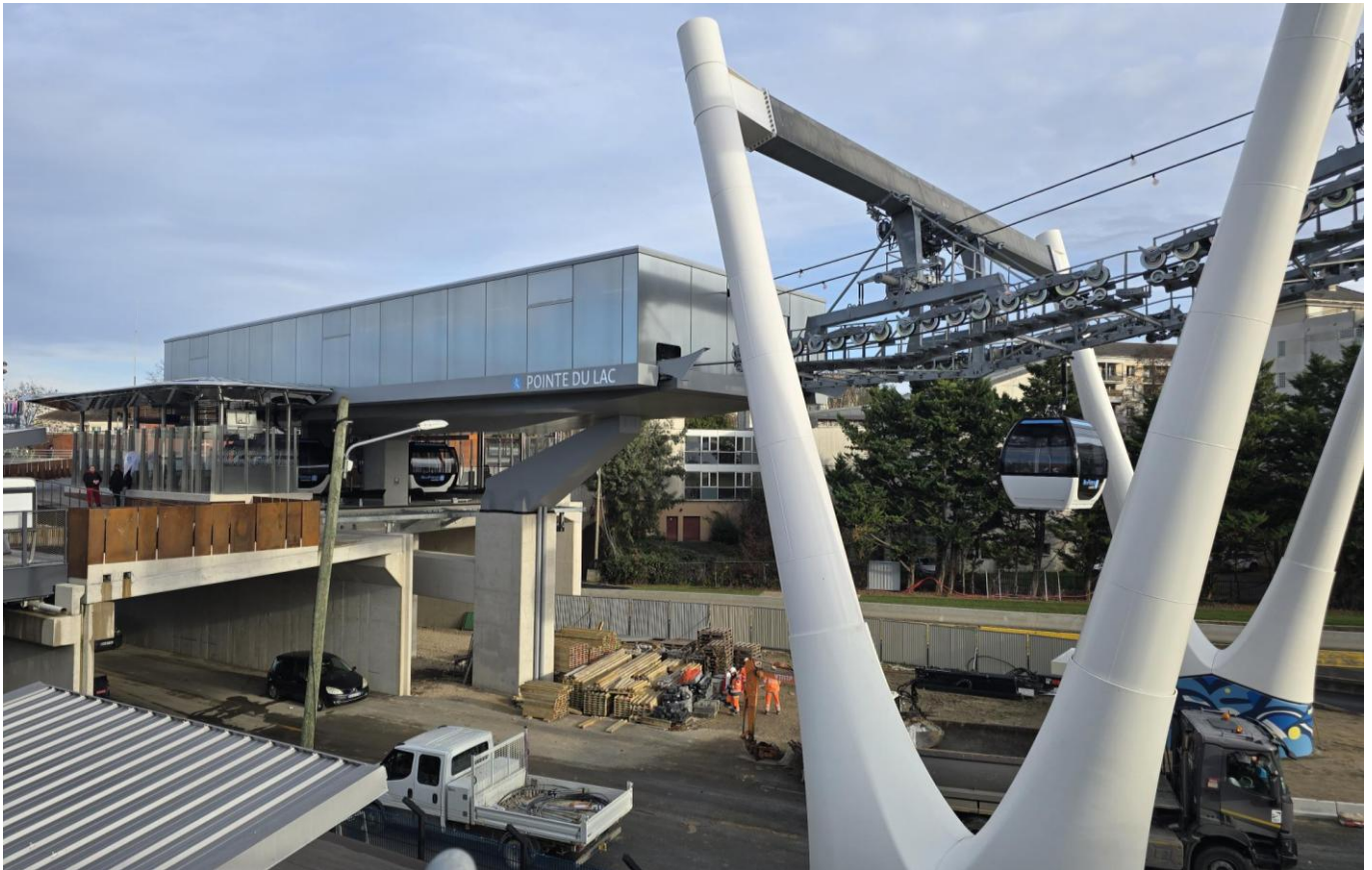
Lac Créteil 駅 3