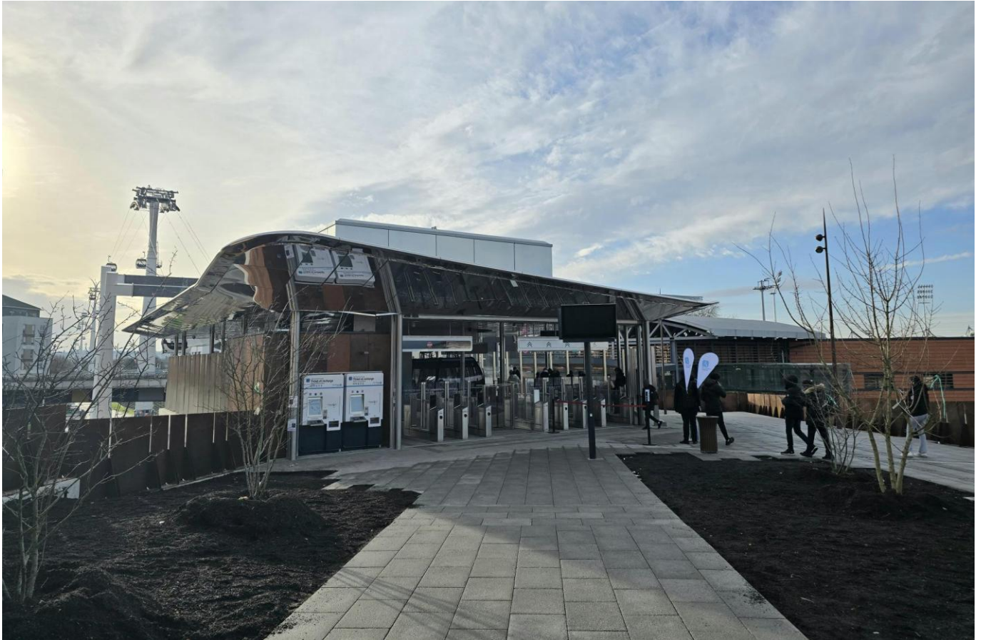
Lac Créteil 駅 1