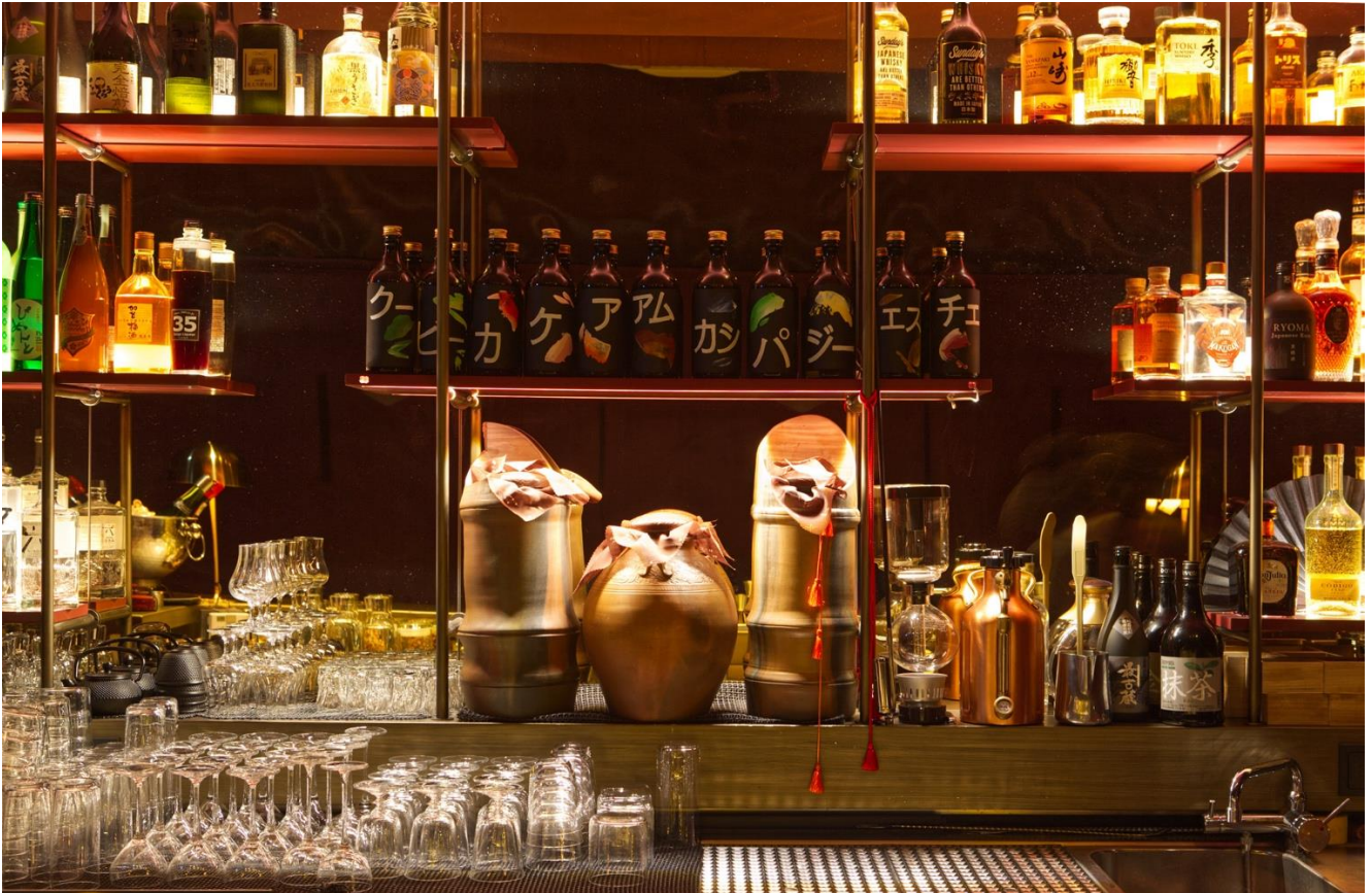
スポットが当たるバックバーに日本語の文字が印象的なボトルや、備前焼の大きな甕を配置している。