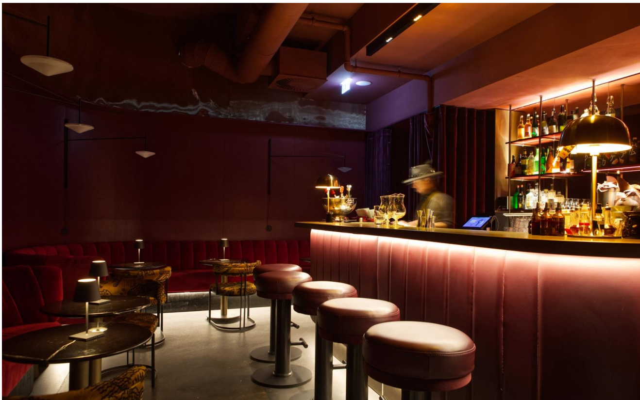
「和風」の解釈が興味深い。タイムレスでエレガントなインテリアを目指したという。ダークな色と照明使いで秘密感を強調。