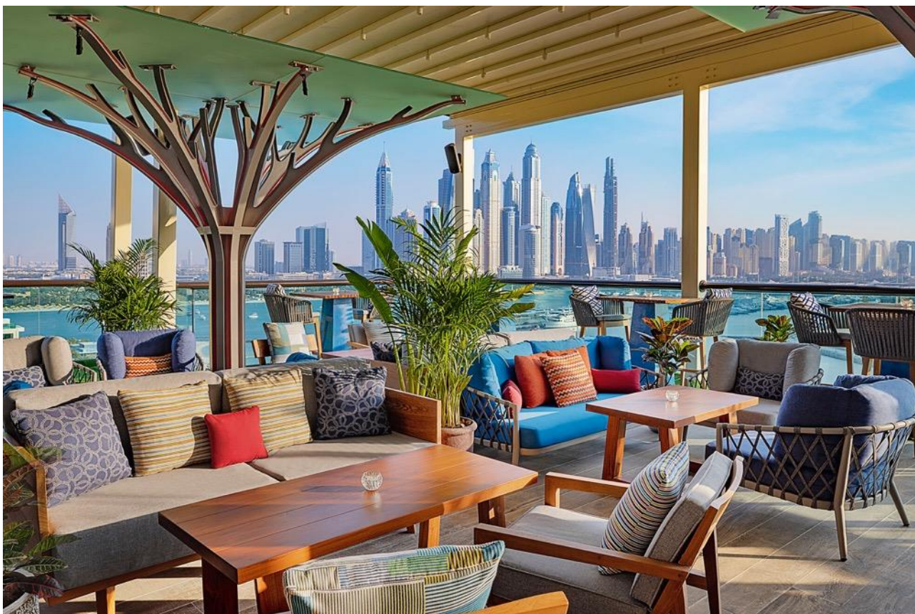
開閉式の屋根とテラスバーを備えたレストラン