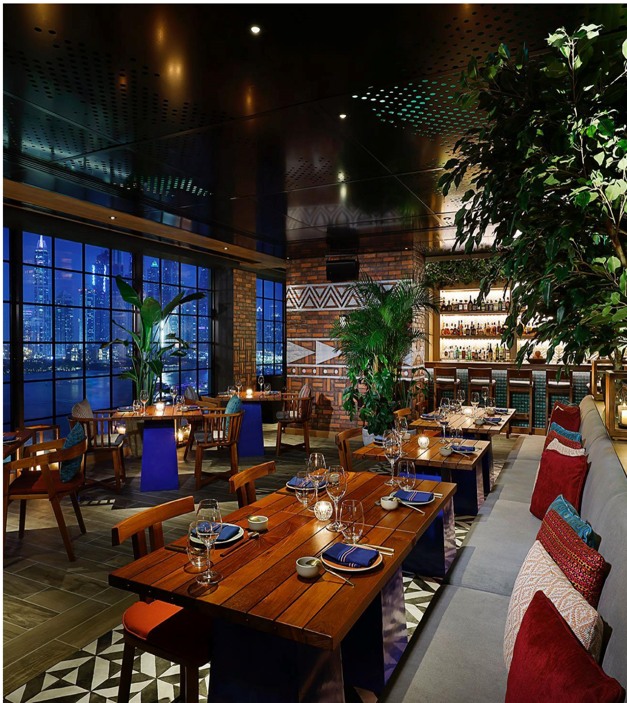
内装は、葉で覆われた天井、アステカ風のアートに彩られた鏡、バナナの葉の木、床から天井までの窓が特徴