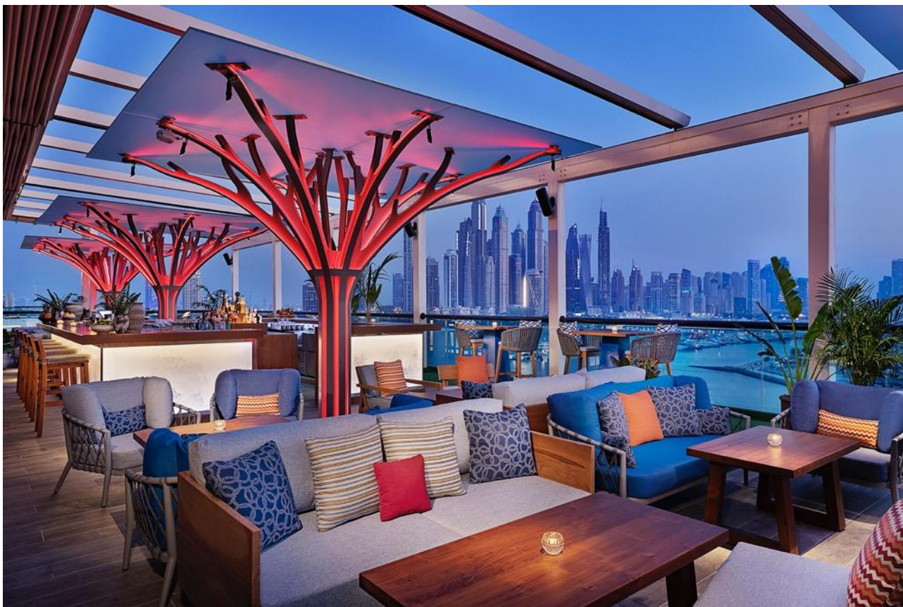
屋上からはドバイ・マリーナの壮大な眺望が楽しむことができる