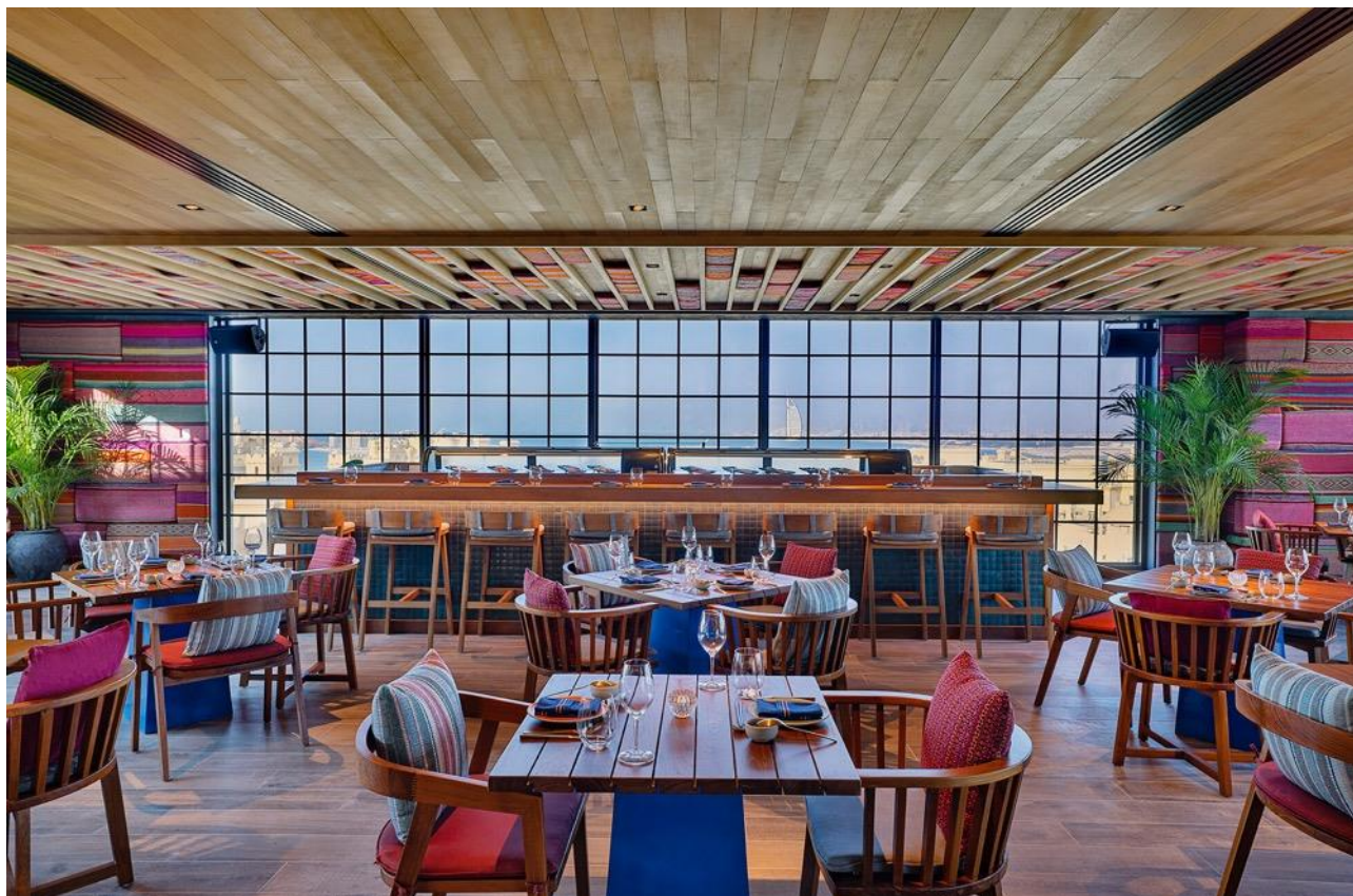
広いダイニングルームと、屋外テラスに面したくつろぎのラウンジェリア