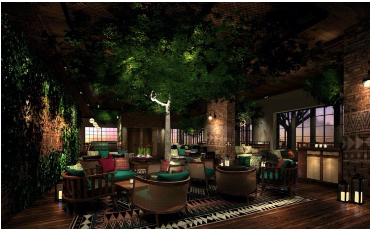
レストランは 270 名まで収容可能