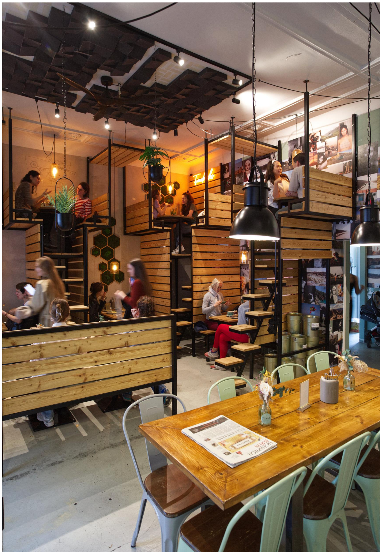
上：天井近くまでお客が入るため、防音パッドを貼った。パッドは幾何学的なデザインをセレクト、天井からグリーンも吊り下げた。