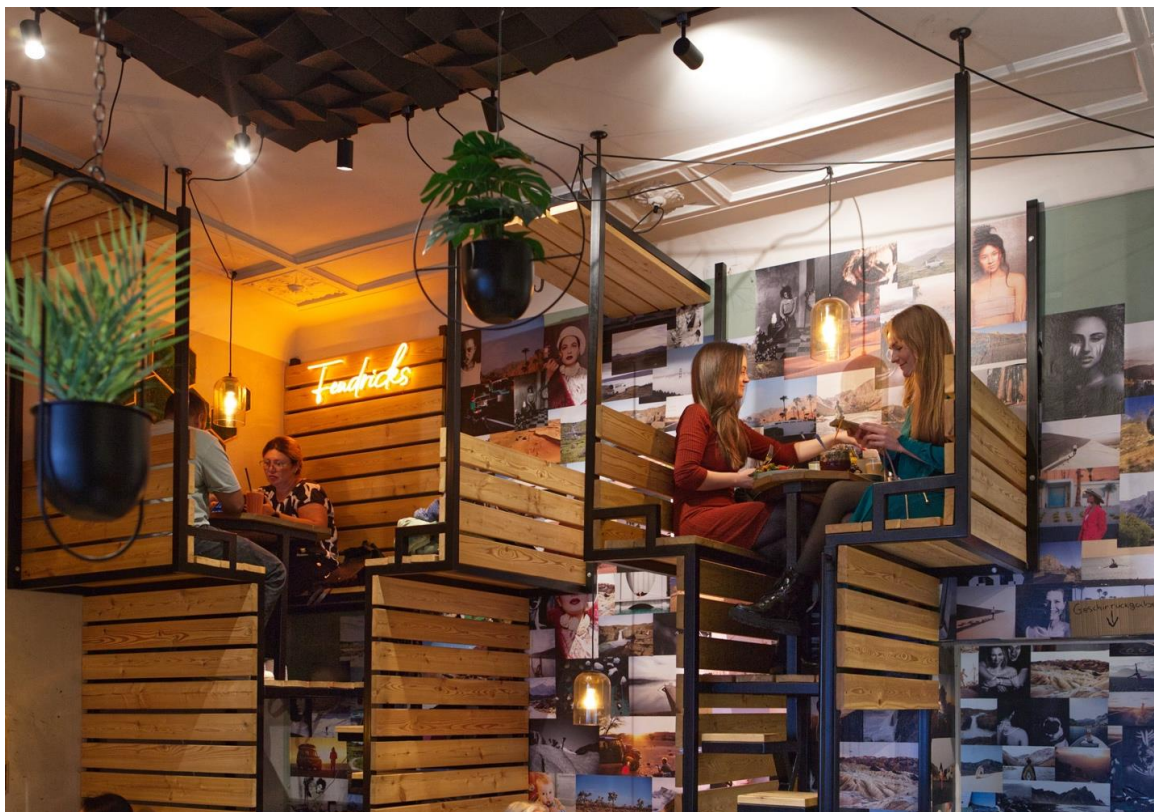
上：階段構造を生かしたテーブル。下右：階段は段違いステップで省スペースに。下左：カウンターの素材も木とブラックメタルで統一。コンセプトカラーのセージグリーンで壁を塗り、食器やテイクアウト用カップ、スツールも同色で揃えている。