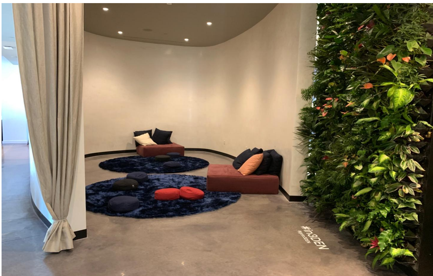
瞑想スペースには、高級ピローやマットレスがある