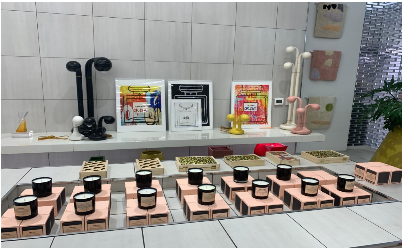
フレグランスと関連するアートを販売するコーナー