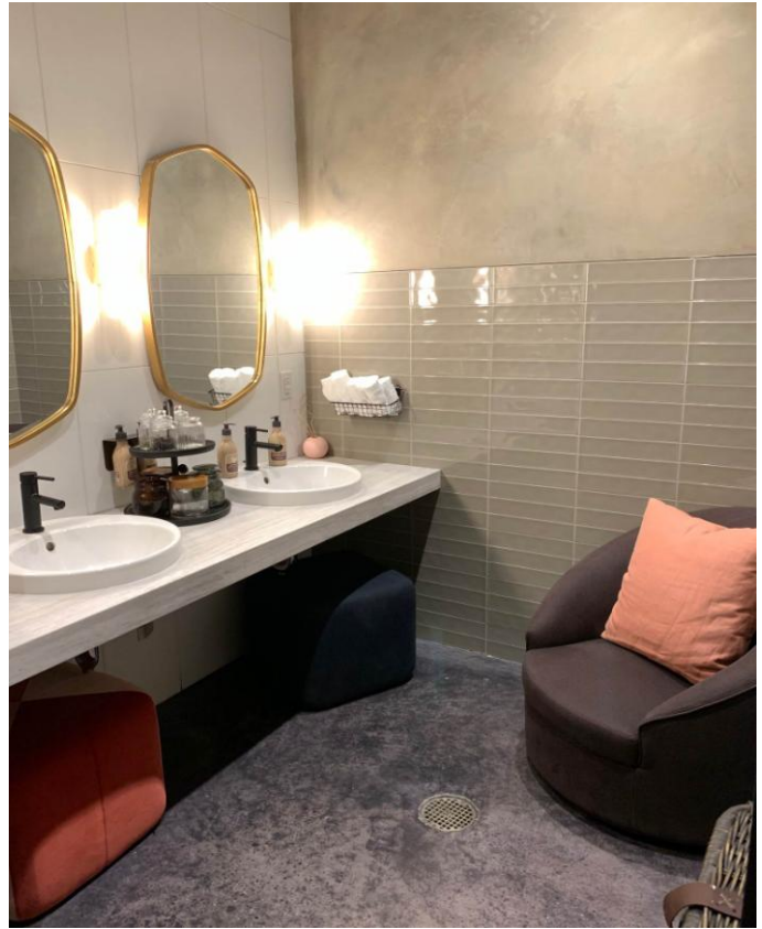
居住性の高いレストルーム、シャワールームも併設