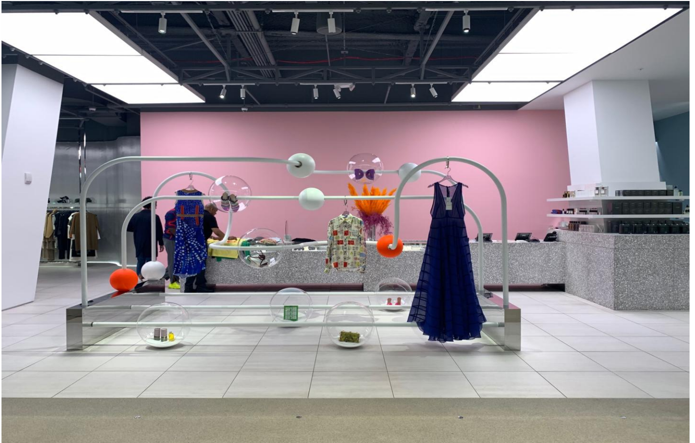
特別な什器を使ったインスタレーションのような陳列