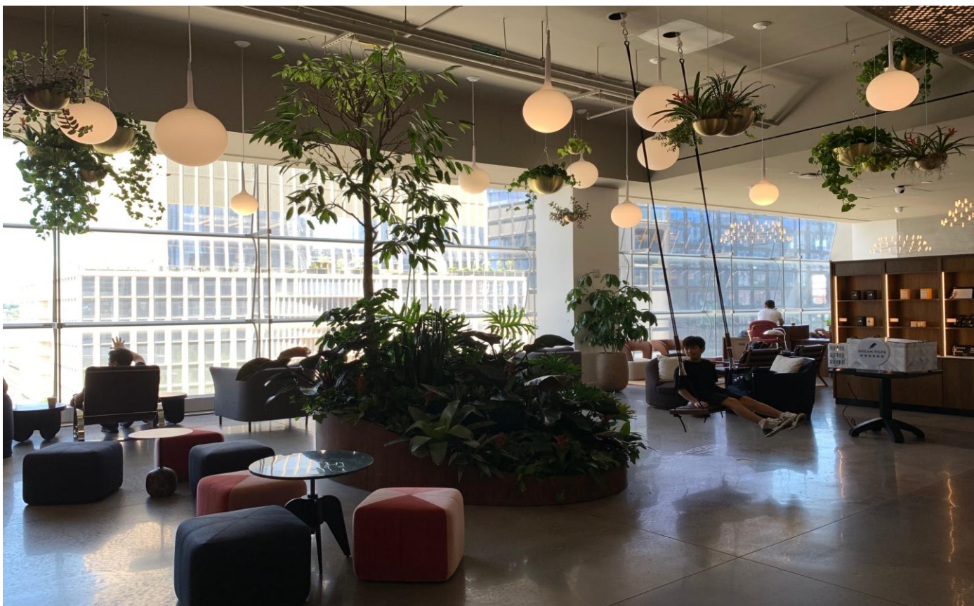
植栽をふんだんに取り入れたメインラウンジ