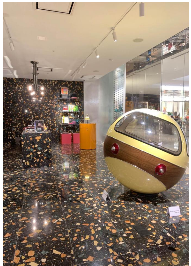
ヴィンテージコーナーは 70 年代の近未来発想がコンセプト