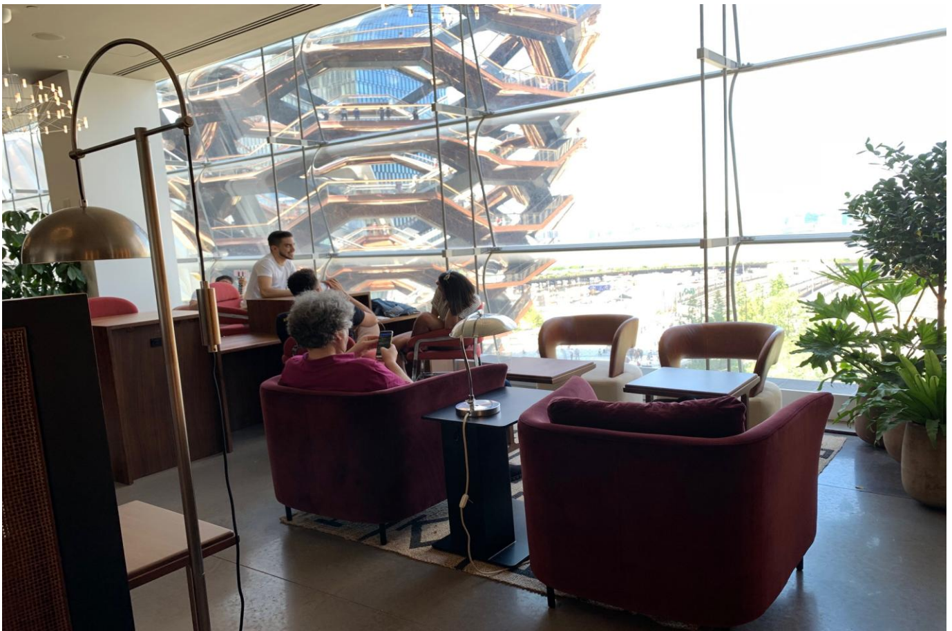
人気インスタレーション Vessel を望む窓辺のラウンジ