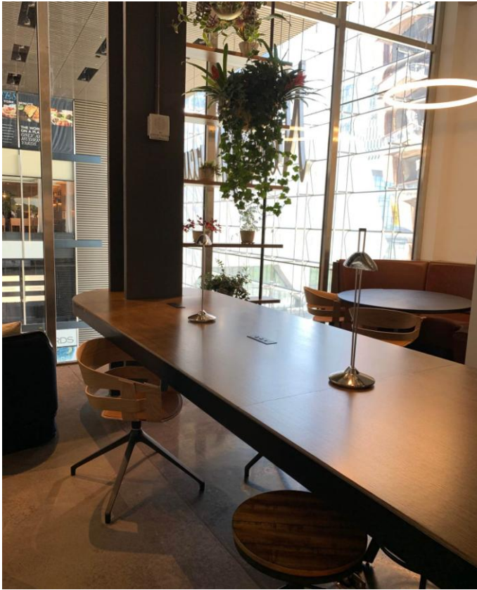
ミーティング&ワークスペース