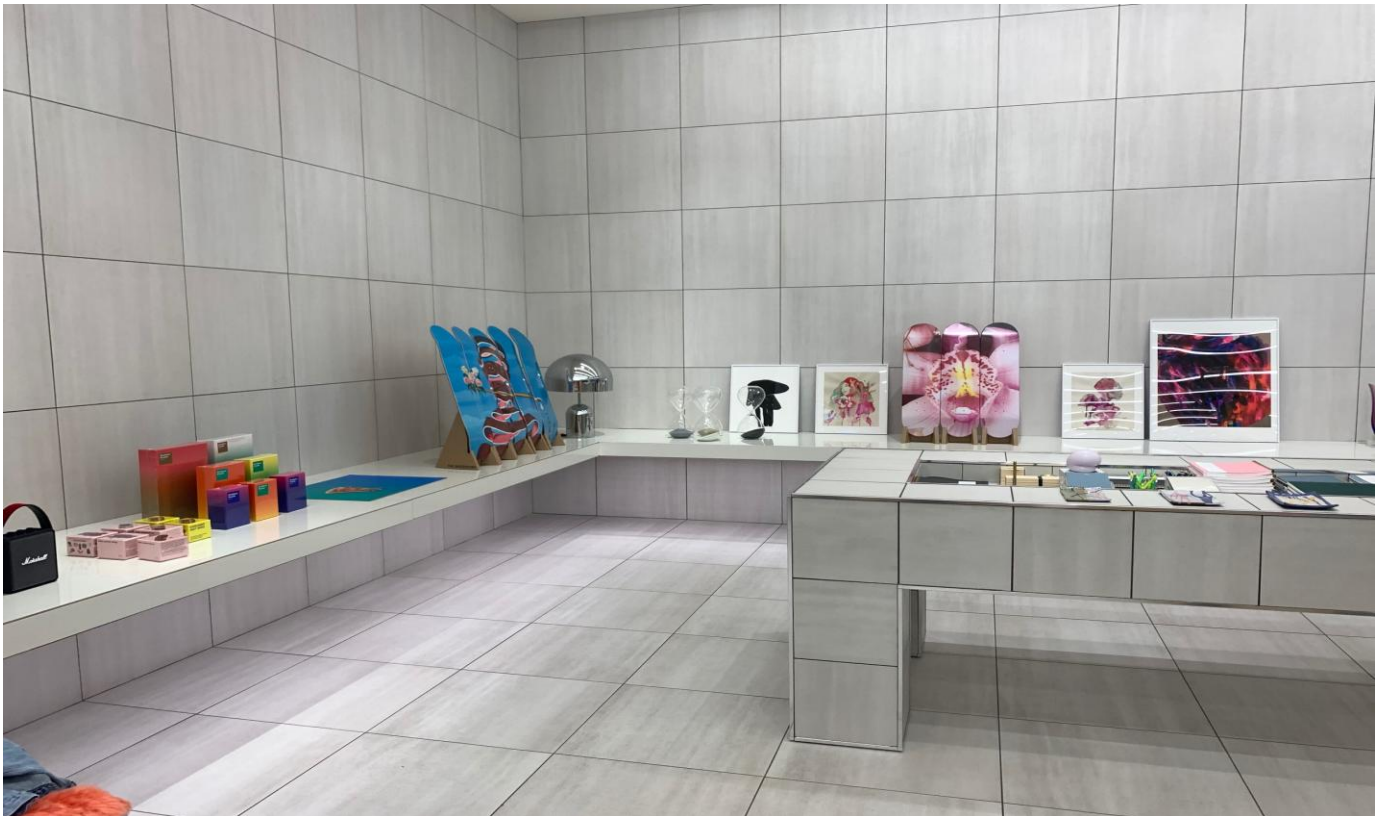
商品を絞り込んだミニマリストティックな雑貨コーナー