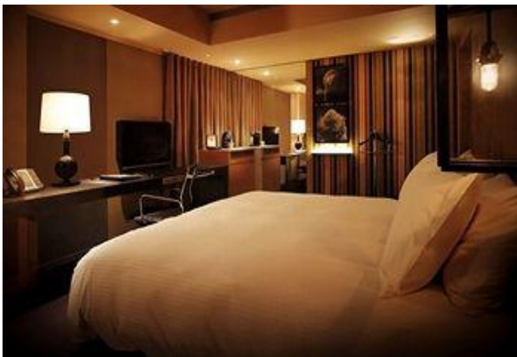
Les Suites (台北商旅)